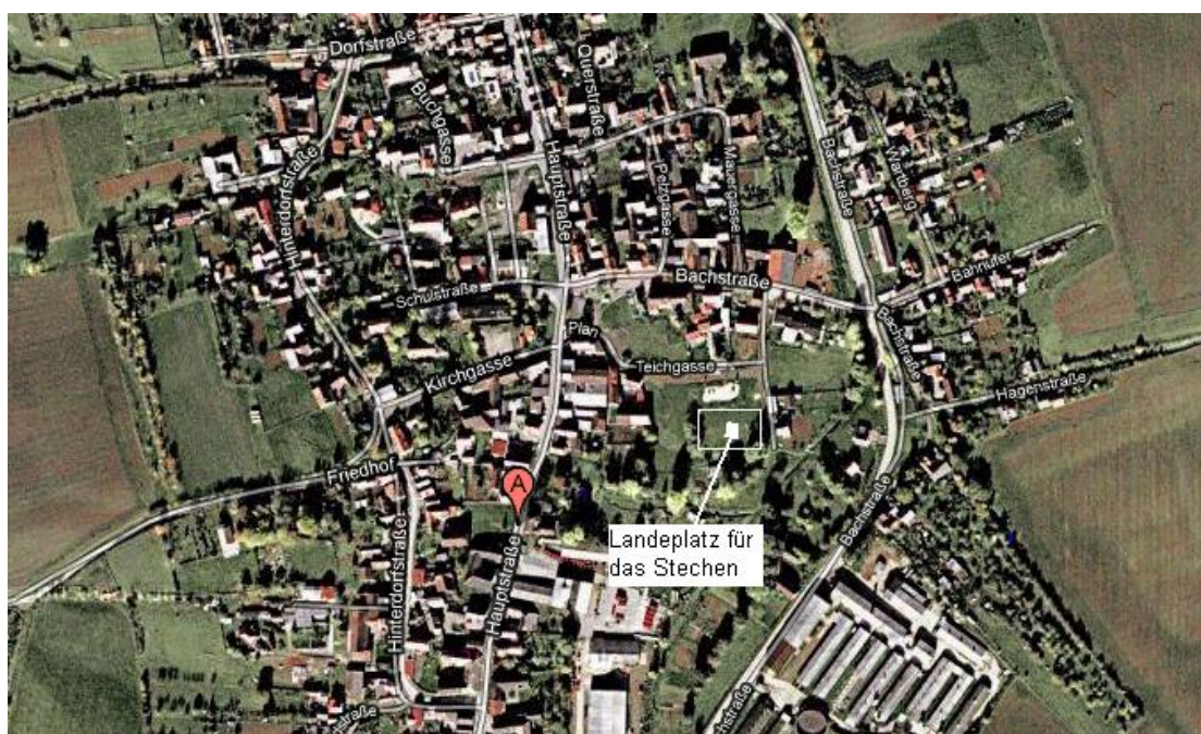
Landeplatz für das Stechen

Ostthüringer Fallschirmsportclub Gera e.V. Flugplatz Gera-Leumnitz 07546 GERA